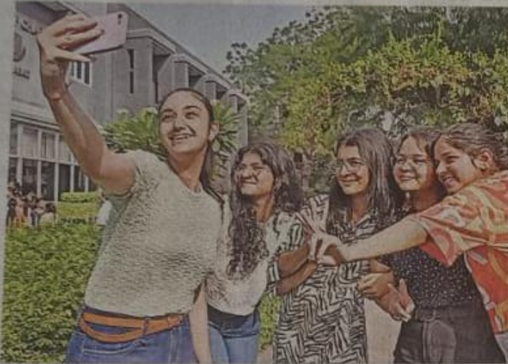
रविवार को आइसीएसई बोर्ड के नतीजे आने के बाद गाजियाबाद के एक स्कूल में खुशी में सेल्फी लेती छात्राएं • जागरण

जागरण संवाददाता, नई दिल्ली: सीबीएसई के परिणामों के बाद रविवार को काउंसिल फार इंडियन स्कूल सर्टिफिकेट एग्जामिनेशन (सीआइएससीई) ने 10वीं और 12वीं के नतीजे जारी कर दिए। सीआइएससीई के नतीजों ने भी बेटियों ने शानदार प्रदर्शन जारी रखा और बाजी मार ली। 10वीं (आइसोएसई) में 99.21 प्रतिशत छात्राएं उत्तीर्ण हुईं जबकि छात्रों की संख्या 98.71 प्रतिशत रही। वहीं, 12वीं (आइएससी) में 98.01 प्रतिशत छात्राएं और 95.96 छात्र उत्तीर्ण हुए। इतना ही नहीं काउंसिल द्वारा जारी 12वीं की मेरिट के 49 विद्यार्थियों में 40 छात्राएं शामिल रहीं। 10वीं में 499 अंक पाकर पांच विद्यार्थियों ने तो 12वीं में नौ छात्रों ने 399 अंक लाकर टाप किया।