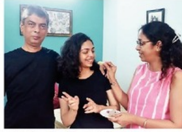
आई-वडिलांनी इप्सिताचे अभिनंदन केले.

देशभरातून दोन लाख ३७ हजार ६३९ विद्यार्थ्यांनी आयसीएसई (दहावी) परीक्षा दिली. त्यात ९८.९४ टक्के विद्यार्थी उत्तीर्ण झाले. तर आयएसई (बारावी) परीक्षेसाठी ९८ हजार ५०५ विद्यार्थी बसले होते. त्यातील ९६.९३ टक्के विद्यार्थी उत्तीर्ण झाले.