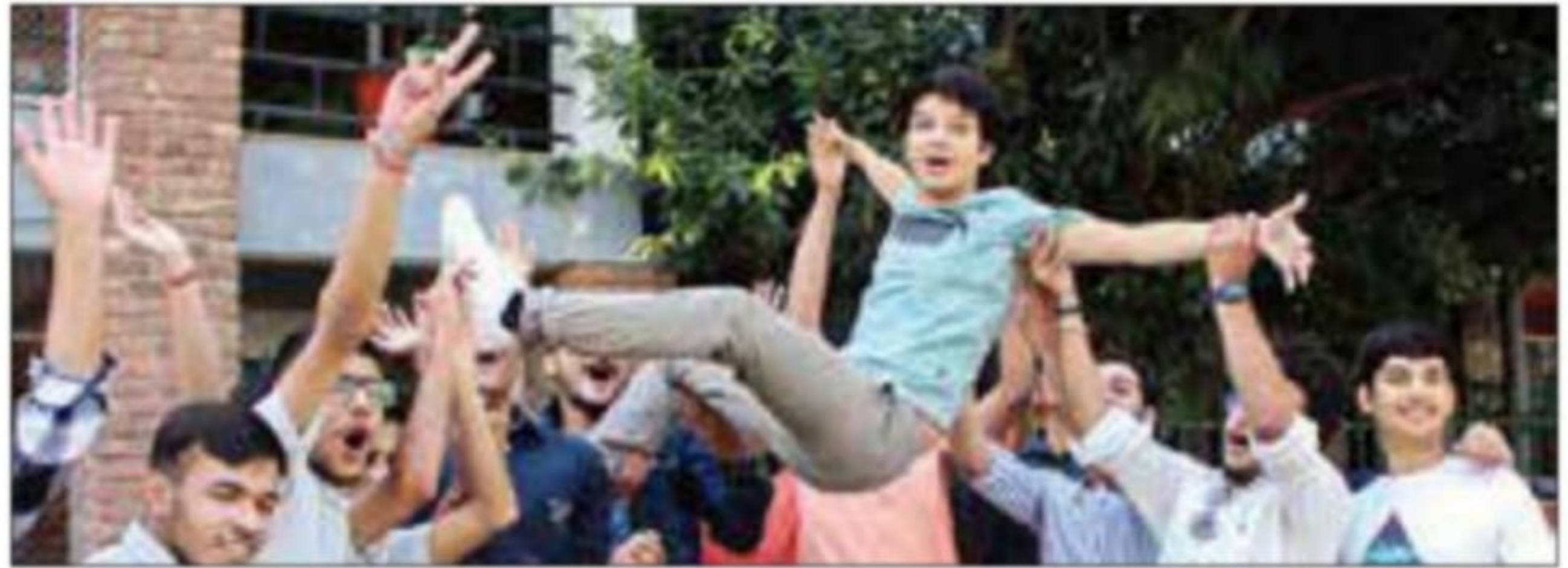
Students celebrate their success after the announcement of ICSE Board class 12th exams results, at a school in Dehradun on Sunday

Girls outshone boys in both the exams with nine students sharing the top rank in Class 10 while five shared the first rank in Class XII. In Class X, nine students shared the top rank with 99.80 per cent marks. They are